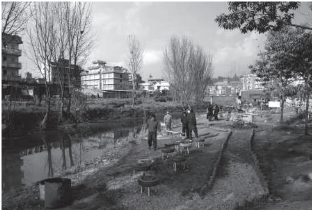
बागमती सफाईको महा-अभियान अन्तर्गत नेपाल एस.जि.आई. ले निर्माण गरेको लोटसवारी