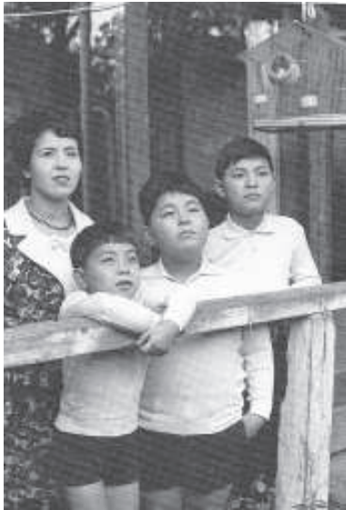
हिमाली शान्ति । जुलाई २०१४

आमाहरूले मात्र नभईकन बुवाहरूले पनि ती अवसरहरूको फाइदा लिन पाउने भए अति उत्तम हुन्थ्यो तर